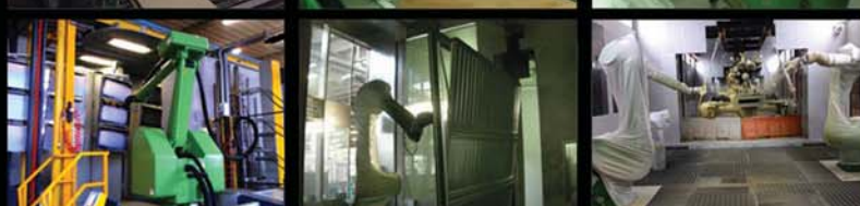
self - teaching